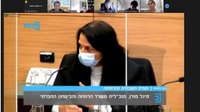
اجتمع الأسبوع الماضي كل رؤساء اللجان في مركز الحكم الإقليمي لتلخيص فعاليات السنة.

شاركت في جلسة بالكنيست حول نشاط وزارة الرفاه. بصفتي رئيس لجنة الرفاه في مركز الحكم الإقليمي وأمثل 54 مجلساً إقليمياً. يوجد تغيير إيجابي بسياسة الوزارة تجاه المجالس الإقليمية بشكل خاص. أرسلت الوزارة "طلب الدعم" لكل بلدات المجالس الإقليمية في إسرائيل وبلدات مسغاف من ضمنها أيضاً. قررت الوزارة الاستثمار ببناء سكن لذوي الإحتياجات الخاصة في البلدات القروية الملائمة. كلي أمل أن يكون أحد هذه المشاريع في مسغاف.