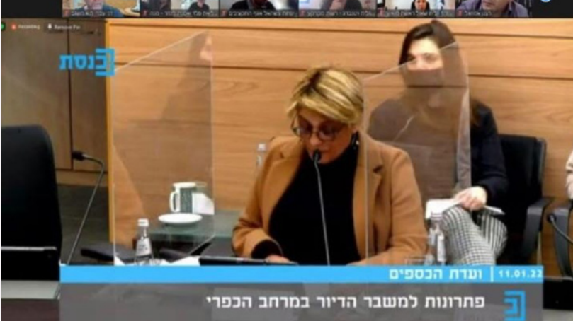
سأطرق في الأسبوع القادم لمجال عملية تخصيص القسائم في بلدات مسغاف.

شاركت الأسبوع الماضي في جلسة بالكنيست حول موضوع "لحل لأزمة السكن في الحيز القروي". عضو الكنيست نيره شفاك (يش عتيد) هي التي بادرت لعقد الجلسة في محاولة منها لسماع ما هي سياسة وزارة الإسكان، مديرية التخطيط وسلطة أراضي إسرائيل. حسب رأيي، بالإمكان تلخيص السياسة باختصار سريع - "طرد الأزواج الشابة إلى المدن وتسويق الأرض بالقرية لكل من يدفع أكثر".